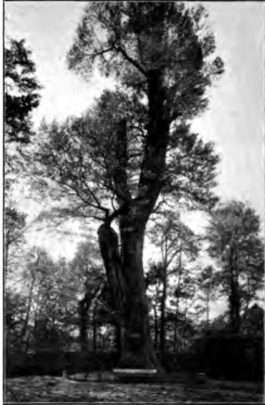
Cote de la Menagère.

longueur, bordée d'arbres et de fossés maintenant remplis de gazon, autrefois creux et enjambés par des ponts. L'entrée de l'avenue est annoncée par une porte faite de deux piliers surmontés de vases monumentaux. A mi-chemin, un rond-point, au centre duquel a été creusé sous le second Empire un bassin avec jet d'eau, décrit une courbe régulière, et l'on pénètre dans le bois par une vaste grille en fer forgé du milieu du XIX e siècle, appuyée à deux pavillons provenant de l'ancienne porte Saint-Bernard. Ce bel arrangement n'étonne pas, quand on en connaît les inspirateurs et les auteurs. C'est le duc d'Enghien, Henri-Jules, fils du grand Condé, qui, vers 1670, donna l'ordre de planter le bois, et c'est Lenôtre qui se chargea de l'exécuter. Les allées, dont le tracé fut prescrit l'année suivante par la municipalité, sont l'œuvre de Dimanche Primard, jardinier du prince. La porte, du prix de 14.000 livres, a eu pour architecte Jean Dubois et pour maçon Jean Clamonet.